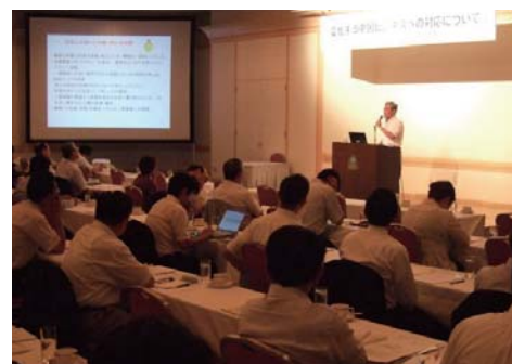
海外展開セミナーの様子