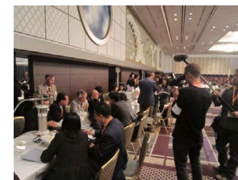
香港貿易発展局と連携した展示商談会の様子