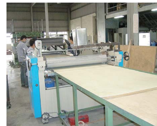
台湾企業の工場(FRP貼り合わせ工程)

台湾ビジネスに精通した専門家から、台湾企業との取引の注意事項、意識ギャップの解消方法等についてアドバイスを受けた。また専門家が台湾へ同行し、台湾企業との交渉を粘り強く行った結果、同社への委託の合意を得た。その後、満足の行く製品づくりまで2年を要するも、その間、知財権保護や契約書作成に関して当機構のアドバイスを受けて適切に対応。量産体制も整い、現在は大手製パン企業の新規車輛への採用が決定している。