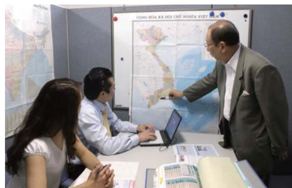
アドバイスの様子

海外ビジネスの専門家が現地へ同行し、立地環境、許認可・規制、従業員の採用や取引先の開拓等について、実践的なアドバイスを実施します。