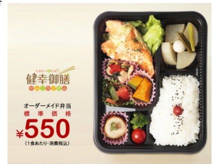
右は宅配弁当の 「健幸御膳」