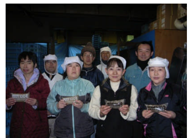
主役となった社員と専務(後列右から1人目)