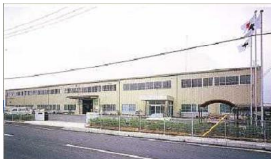
ソフトプレ工業株式会社 本社