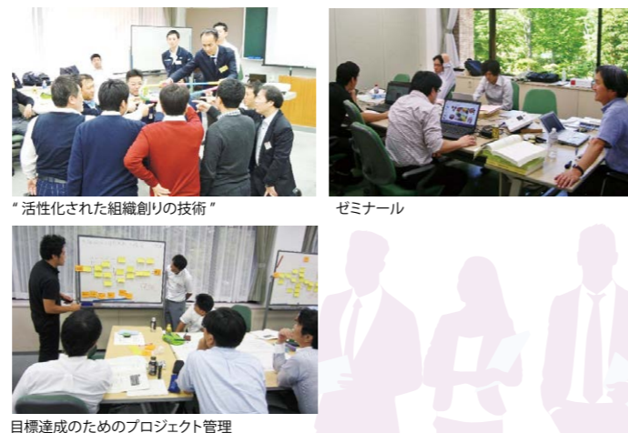
"活性化された組織創りの技術"