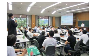
派遣元による講評