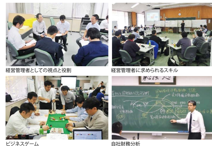
経営管理者としての視点と役割