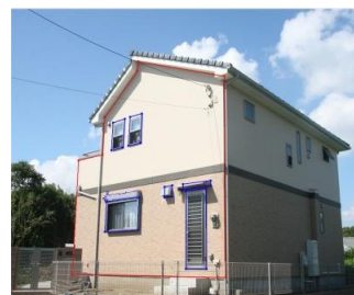
面積算出エリアと除去エリアの指定