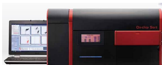
ダメージフリー・セルソーター“On-chip Sort”

12月のテーマは、入居者であるオンチップ・バイオテクノロジーズの「マイクロ流路チップ・セルソーター」を使ったアプリケーション事例を紹介します。