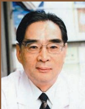
プロフィール 横浜市立大学大学院 医学研究科 情報システム予防医学