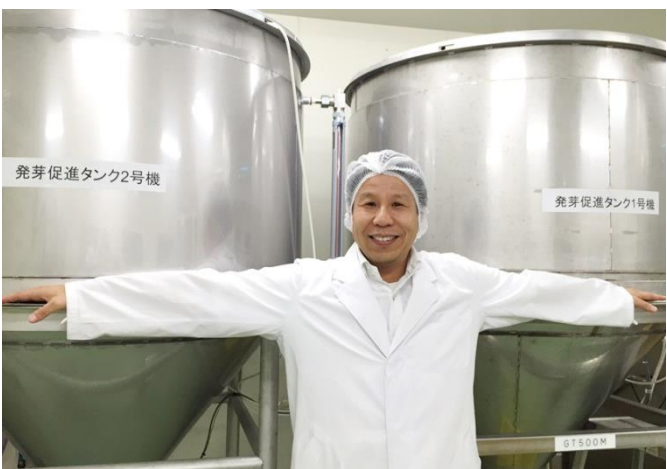
「落合式ハイプレッシャー法」発芽促進タンク