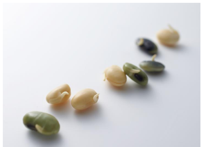
天然化合物のリソースとなる発芽大豆

大豆エナジー(旧名ベジタブル製菓)は、ベビーリーフ最大手の 果実堂 グループから誕生したバイオベンチャー企業です。従来の生薬的な発想で植物の根、茎、葉に有効成分が溜まるのを待つのではなく、植物ゲノム解読の進展を背景に、積極的に植物の〈種子〉に働きかけ、眠っている遺伝子を揺り動かし、短期間のうちに 多種多様な有効成分 を大量に産生することを目指しています。この産生を可能にする当社の <落合式ハイプレッシャー法> は、特許技術です。(特許第 5722518号/特許第 5795676号)