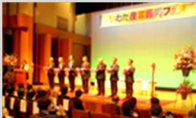
* 出展企業(順不同) *

広域交流による新産業の創出と工業技術を次世代農業へ活用することを目的に開催されました