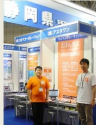
* 出展企業 * (順不同)

最大規模の展示会とあって、大手企業からの引合いや来訪者名刺を100枚以上獲得するなど大きな成果を得ることができました。