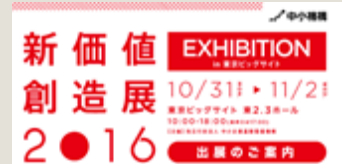
* 出展企業(順不同) *

中小企業が持つ優れた製品・技術・サービスを展示して、ビジネスマッチングにつなげる展示でした