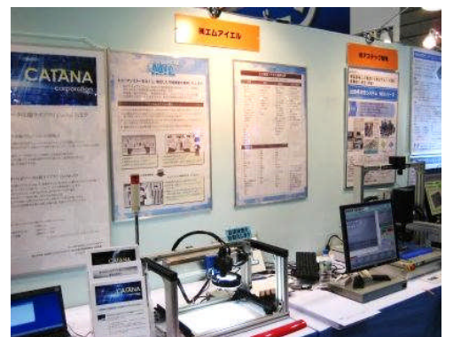
(株)エム・アイ・エル