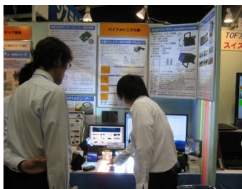
パイフォトンクス(株)