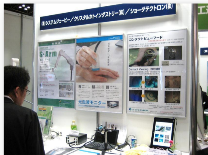
クリスタルホトインダストリー(株)さんの展示