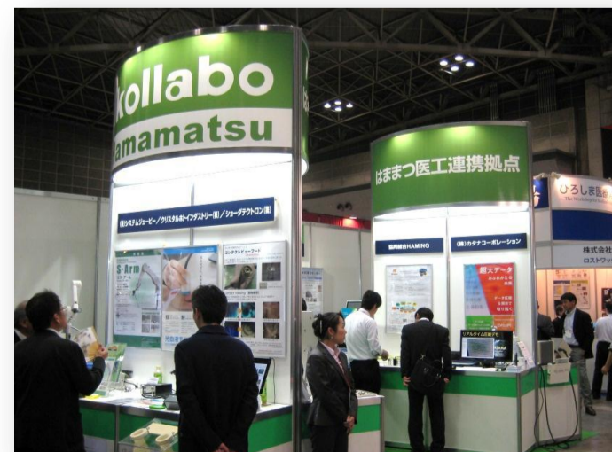
はままつ次世代 光・健康医療産業創出拠点