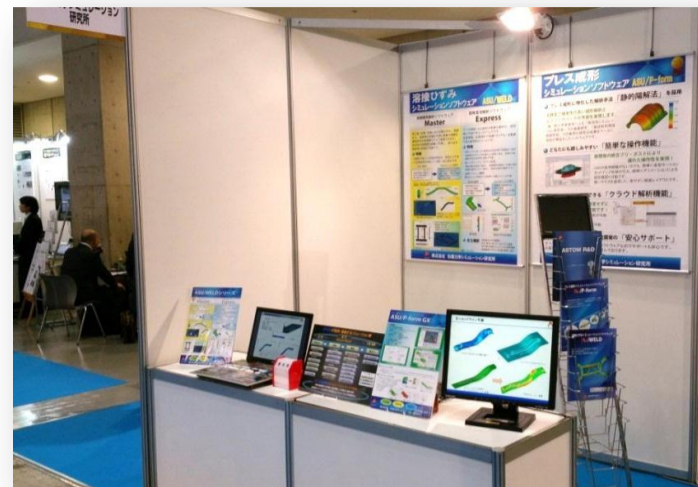
(株)先端力学シミュレーション研究所さんのブース

出展が「CAEブース」では無かったので、弊社への訪問者は他社に比べると多くはありませんでしたが、浜松を中心としたユーザー様にわざわざお立ち寄りいただき、4日間楽しく過ごすことが出来ました。立ちっぱなしでしたので、疲労は激しかったです・・・。 (堤センター長談)