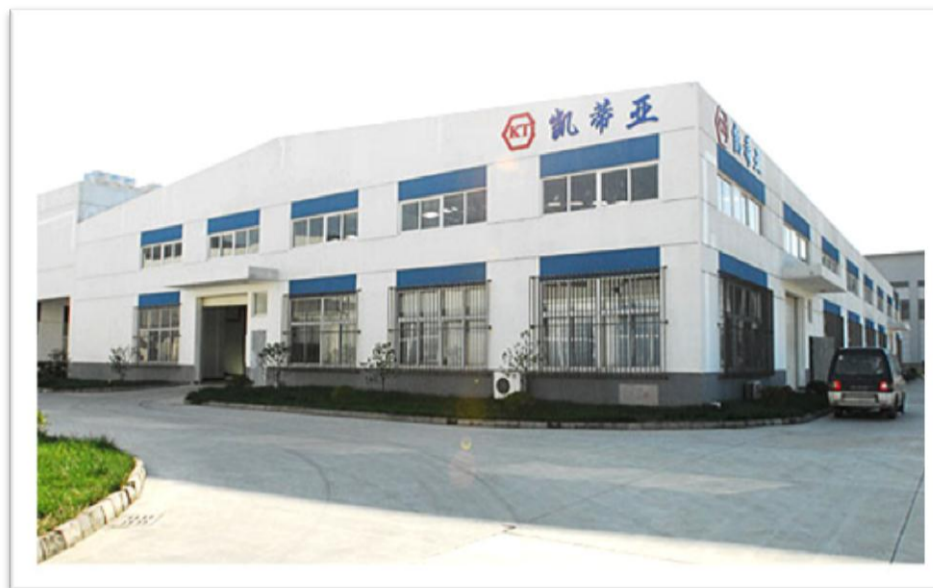
中国蘇州にある(株)KTI本社工場