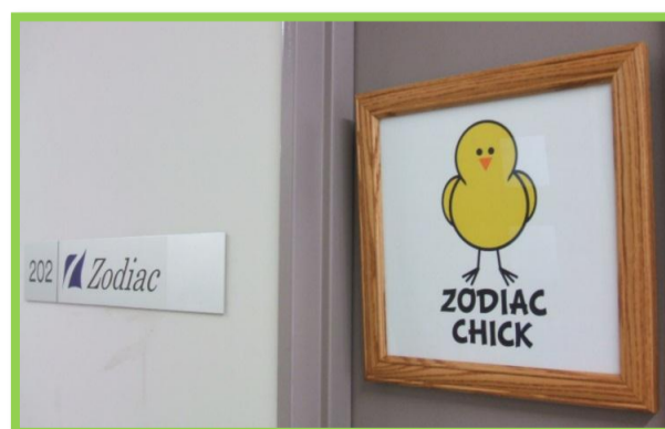
図2:可愛い“ZODIAC CHICK”が目印です★