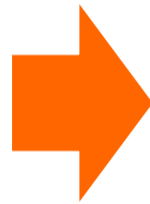
8本に分割されて出てくる！