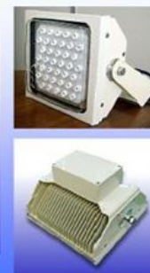
GL400B-WN40 (レンズ付) **GL400B-WN15/25 もあります。