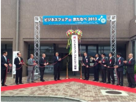
【オープニングセレモニー】