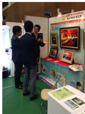
【カメラのトモミ堂】