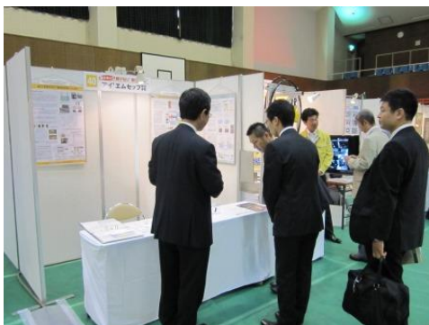
【アイ'エムセツプ(株)】