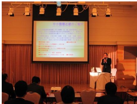
【ビジネスピックアップセミナー】

10月22日(火)、同志社大学 京田辺校地多々羅キャンパスにて、「ビジネスフェア in 京たなべ2013」が開催されました。