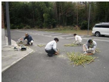
②伐採した竹の枝を落とし長さを均等にします。