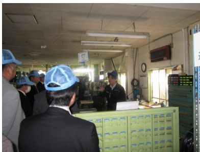
【株式会社中農製作所工場内見学の様子】