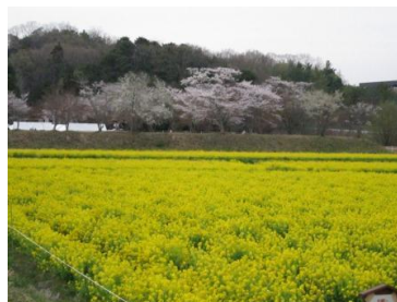
④昼の観音寺周辺様子