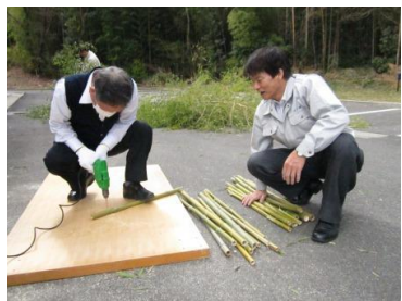
③均等にした竹に加工できるような穴を開けます。