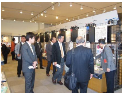
【MOBIOものづくりセンター常設展示場にて】

3月21日(木)に開催された、京田辺市商工会工業部会主催の企業・施設見学会に参加しました。