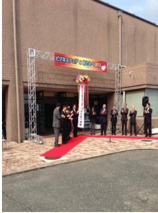
【オープニングセレモニー】