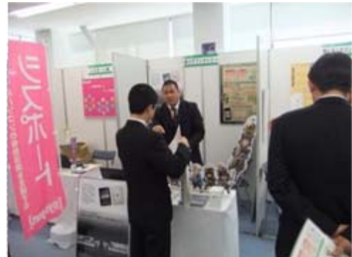
株式会社コアファクトリー