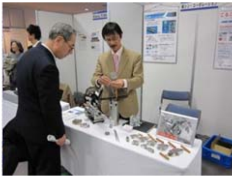
株式会社シン・コーポレーション