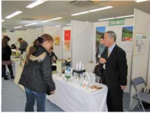
有限会社アップル・ワイズ