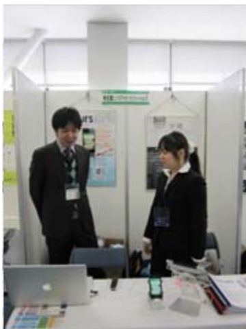
株式会社吉蔵エックスワイゼットソリューションズ

D-eggからは、7社の出展がありました。 ものづくり企業からIT企業と業種は色々でした。 皆さん、参加ブースに立ち寄られた方々に、自社製品の説明を熱心にされていました。 また、参加された企業同士や地元企業さんとの交流も深まり、実のある展示会になったのではないのでしょうか。