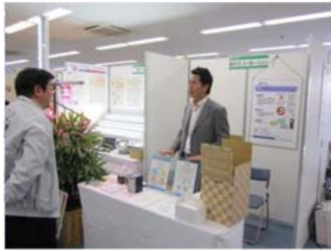
株式会社オクダ・コーポレーション