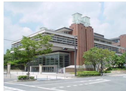
写真：同志社大学リエゾンオフィスが居室を構える