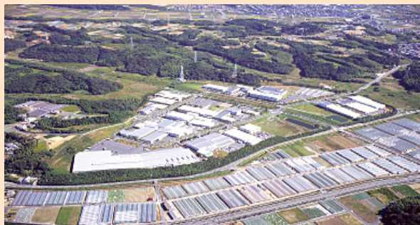
集団化事業の例： 浜松技術工業団地

中小機構と都道府県が一体となって資金協力します。受付・相談は、各都道府県の中小企業担当課又は中小機構 地域振興企画課へ