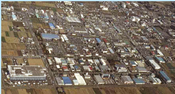
集団化事業の例： 熊谷流通センター

中小機構と都道府県が一体となって資金協力します。受付・相談は、各都道府県の中小企業担当課又は中小機構 地域振興企画課へ