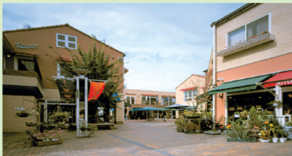
集団化事業の例： 都城オーバルパティオ

中小機構と都道府県が一体となって資金協力します。受付・相談は、各都道府県の中小企業担当課又は中小機構 地域振興企画課へ