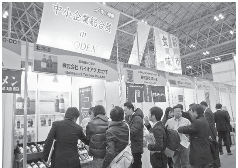
昨年の「中小企業総合展 in FOODEX」