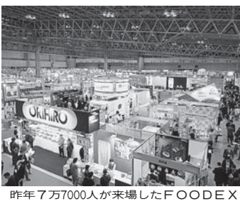
昨年7万7000人が来場したFOODEX

3月8日(火)〜11日(金)の4日間、幕張メッセで開催される「中小企業総合展 in FOODEX」には、103社が出展する。この中には、海外市場への販路開拓を支援するための様々なサービスを提供する。また、海外市場への販路開拓を促進するための様々なサービスを提供する。