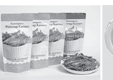
わかさざかりんとう