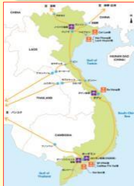
出所:JETRO「はじめてのベトナム進出」 https://www.jetro.go.jp/ext/images/world/reports/2015/pdf/07001109_2/vn_firsttime201503r