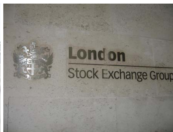
〔写真〕：ロンドン証券取引所

ロンドンAIMは1995年に設立され、現在はアメリカのナスダックに次ぐ新興企業のための資金調達市場としての地位を築いている。証券取引所そのものから課される規制が少なく、例えば資本や発行株式数についての要求が極端に少ない。そのため、ロンドンのメイン市場からAIMに転換する企業も存在する。2005年のデータでは、40社がメイン市場からAIMに転換している。