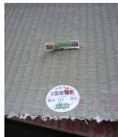
トレーサビリティを把握する国産畳

当商工会議所では、セミナーを開催し、受講した小規模事業者を対象に、徹底した巡回訪問を実施する。受講者は、必ず課題を抱えており、支援ニーズが高いと判断するからだ。特に、経営計画策定は、事業を見つめ直す機会であり、今回のように事業者の経営意識を向上させる。