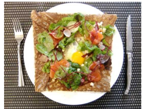
上: ナイフとフォークで食べるお洒落な「白馬ガレット」(プチホテルアンシャンテ提供)。「白馬ガレット」は、白馬産のそば粉を用い、白馬豚や信州サーモン、季節野菜など地元食材をトッピングしたそば粉のクレープ。認定された「白馬クレーピエ」だけが提供できる。左上: 「白馬ガレット」のマーク。この看板のある宿泊施設や店でメニューを提供している。