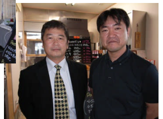
梅津指導員(左)と後継者(右)