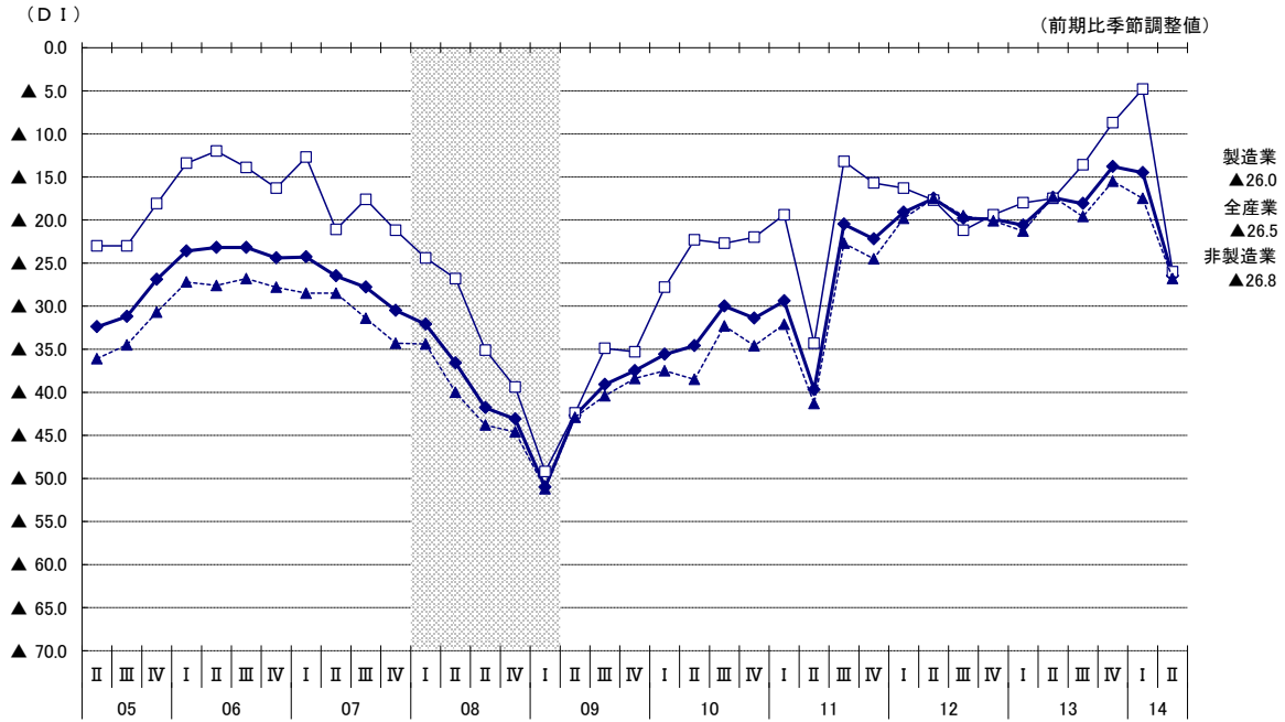
[参考1] 各県の中小企業の業況判断D I 推移