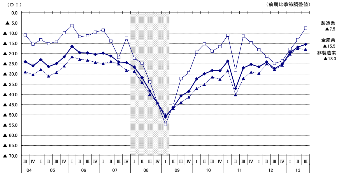
[参考1] 各県の中小企業の業況判断D I 推移