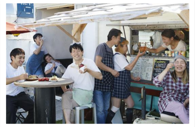
「定着人材」が多い石巻市の橋通りCommonの初期メンバー

地域の活性化を担い、持続的な地域経営を行っていくために一番重要なこと。それは地域に定着し、活動していく「プレーヤー」の存在です。主体的に取り組む活発な「プレーヤー」の数は、地域の活力のバロメーターです。しかしながら、多くの地域においては「プレーヤー人材不足」が深刻な問題となっています。あなたの地域では、「プレーヤー」は足りていますか？ 実は、地域内外から中心市街地に人材が「定着」し、新たな価値やコミュニティを創造している地域があります。「プレーヤー」を増やし、持続的な地域づくりを進めている地域の取り組みはどのようなものなのか？ 人材の定着に必要なことは？ まちの「プレーヤー」の増やししかたを学び、あなたの地域でできる取り組みを見つけてみませんか？