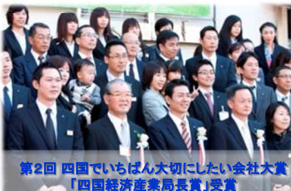
第2回 四国でいちばん大切にしたい会社大賞 「四国経済産業局長賞」受賞