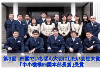
第3回 四国でいちばん大切にしたい会社大賞 「中小機構四国本部長賞」受賞