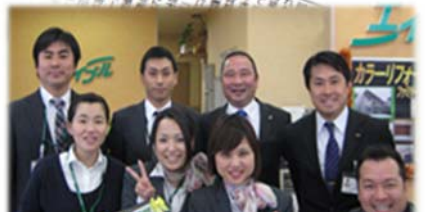
第1回 四国でいちばん大切にしたい会社大賞 「奨励賞」受賞