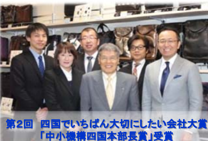
第2回 四国でいちばん大切にしたい会社大賞 「中小機構四国本部長賞」受賞