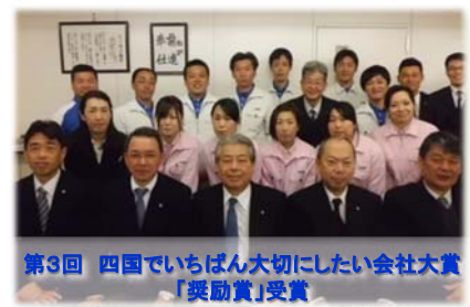
第3回 四国でいちばん大切にしたい会社大賞 「奨励賞」受賞