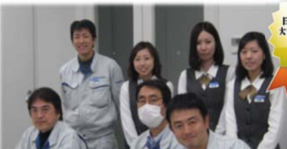
第1回 四国でいちばん大切にしたい会社大賞 「中小機構四国支部長賞」受賞