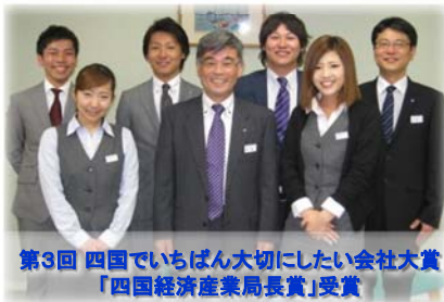
第3回 四国でいちばん大切にしたい会社大賞 「四国経済産業局長賞」受賞