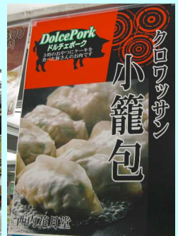
(西内花月堂様の売り場と新商品ポスター)