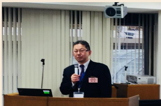
販路開拓部長 挨拶

コーディネーター勉強会は、販路開拓コーディネーターを一堂に集めて、年2回実施しています。これまでは、支援スキルのアップに資する課題解決型の演習を中心として実施してきました。