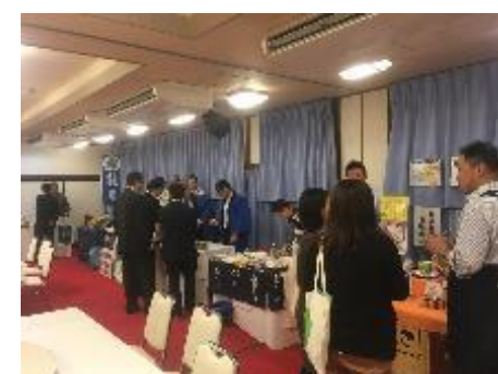
↑展示・巡回型商談会イメージ