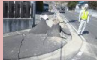
震災による白石市内の被災状況