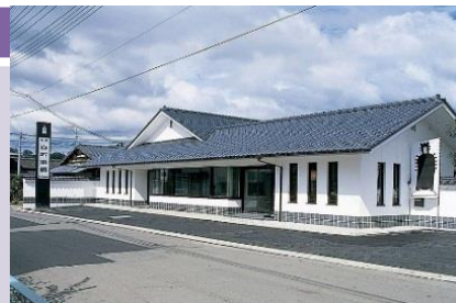
(株)きちみ製麺の外観