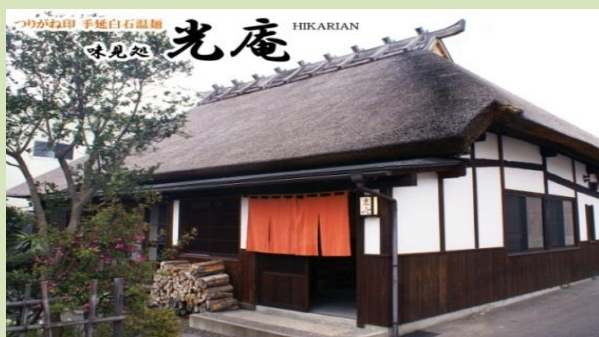
茅葺屋根の外観 敷地内の約300年前に建てられ た武家屋敷を改装

直営 味見処「光庵」開店 平成26年5月 平成26年(初年度)においては目標売上高を概ね達成。