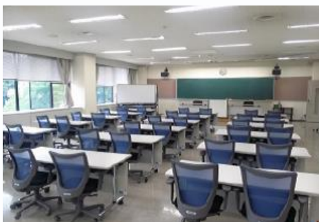
● 教室 大教室(80名) 中教室(50名)

○ 人材は、磨いて初めて「人財」になります。成長が期待される時代。御社の発展のため、 仙台校 をご活用ください。