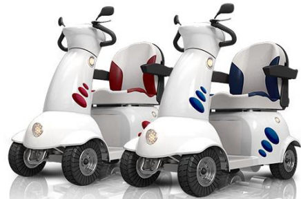
電動シニアカー「てくてっくん」 デザインと安全機能に徹底的にこだわった新しいタイプのシニアカー

今回のセミナーでは東洋製作所の新規事業として取り組んでおられる電動シニアカー事業についてお話頂きます。開発の背景、思い、経緯、活動内容、現状の課題、今後の方針などの貴重な体験談をご紹介頂きます。