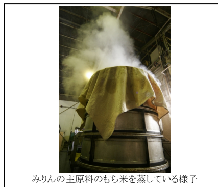
みりんの主原料のもち米を蒸している様子