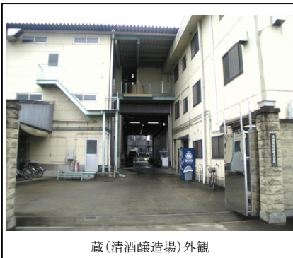
蔵(清酒醸造場)外観

伝統の技術に加え、最新の設備での麴・酒母造り、コンピューター制御による温度管理、自動攪拌により、安全に徹底した品質管理を行っています。弊社は年間通じて清酒造りを行っており、高品質で安定したお酒をお客様にご提供できます。また、パック詰めラインも充実しており、3Lから180mlまでのパック商品、瓶商品の製造を行っています。