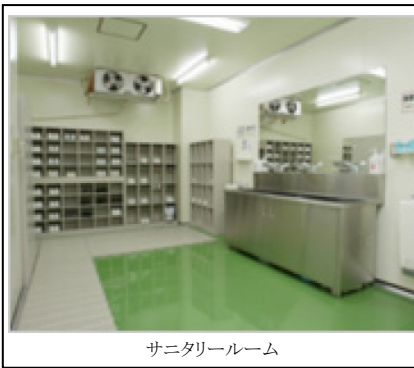
サニタリールーム

三陸のほやは、その7割が宮城県産であるが、生食文化であり国内の需要が進展していない。またその形状と鮮度の問題により、全国でも有数の嫌われる食材となっている。しかし、ほやは5つの味が揃っているといわれる稀な食材であり、栄養価も高く評価されている。弊社は、このほやを初心者用・中級者用等10種類以上の商品開発をし、ほやの新しいニーズを提供することによってファンの拡大にまい進している会社である。