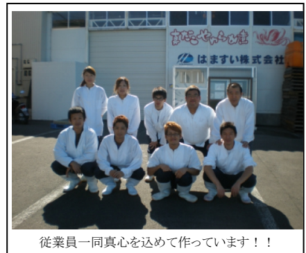
従業員一同真心を込めて作っています!!