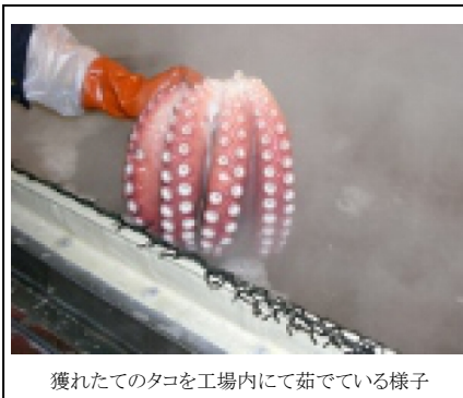
獲れたてのタコを工場内にて茹でている様子