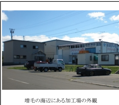
増毛の海辺にある加工場の外観

弊社では、水産加工場に直結した「-35℃急速冷凍結庫・保管庫」において、原料及び製品を急速冷凍することにより、長期間保存が可能で冷凍やけをしない水産加工品を提供することができます。また、平成25年度の食品衛生優良店舗として留萌振興局長から表彰を受けています。