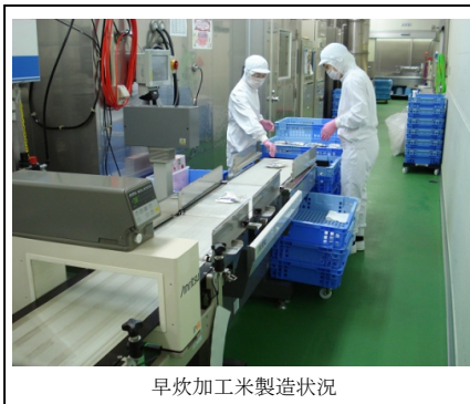
早炊加工米製造状況