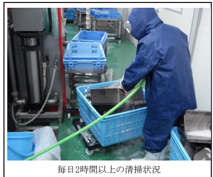
毎日2時間以上の清掃状況