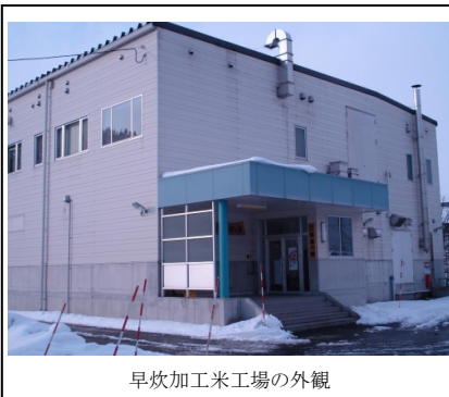
早炊加工米工場の外観

稲作は福島県からエコファーマーとして認定されており、環境に優しい農業に努めています。製造工程ではHASSAPに準拠した品質管理、衛生管理を徹底し、第三者機関による検査の実施や金属検出器やX線検査器の導入で異物除去にも注意を払っています。