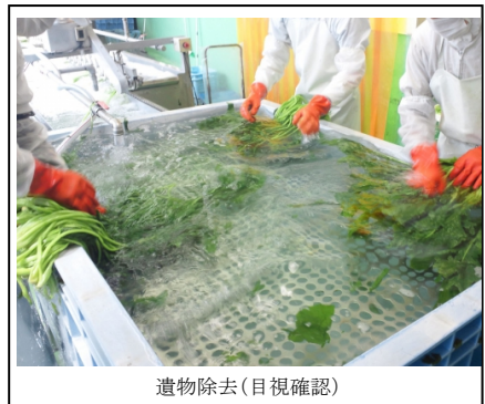
遺物除去(目視確認)