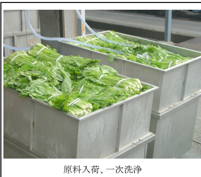
原料入荷、一次洗浄

原料入荷→一次洗浄→塩漬→2次洗浄→遺物確認(目視)→選別、計量→包装→金属探知機→検品・箱詰め→出荷 ○原料入荷後直ちに熱伝導率の良いステンレス製の容器の中で氷温まで冷やすことでシャキシャキ感が長続きます。 ○全長13mの洗浄ラインと目視確認による遺物確認により100%に近い遺物除去を行っています。