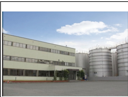
辻製油・うれし野ラボの親会社

素材の香りを最も引き立てられるよう、なたね油・とうもろこし油・オリーブ油を素材毎にオリジナルでブレンドした油をベースに使い、直火でじっくり炊き出しを行っています。 製造から品質管理までは、なたね油・とうもろこし油をメインに製造している実績の豊富な老舗製油メーカーで行っており、信頼のある製品作りに取り組んでいます。